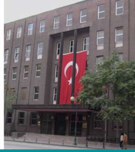
Merkez Bankası İdare Merkezi - Rölyef