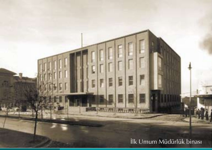
İlk Umum Müdürlük binası