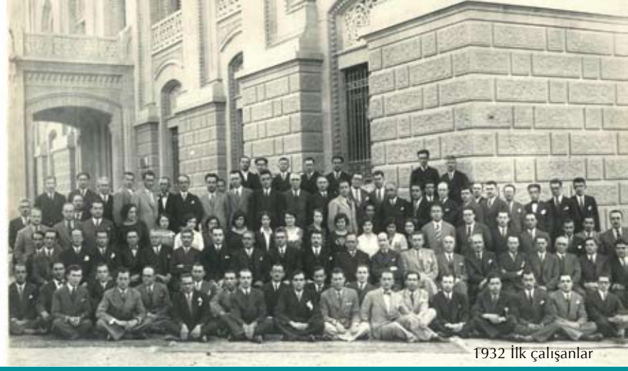
1932 İlk çalışanlar