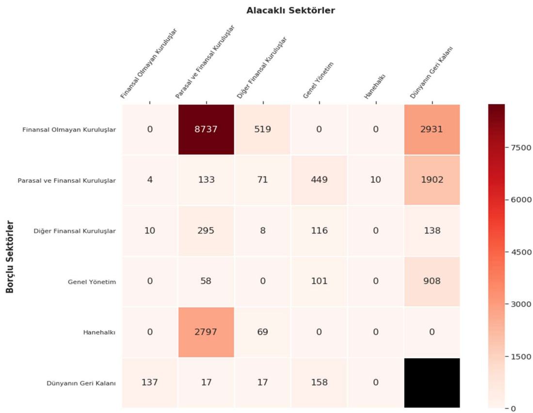
Grafik 28: Krediler, Kimden-Kime (Milyar TL)

Kredilerin kimden-kime matrisleri incelendiğinde, 2023 yılı dördüncü çeyreğinde en büyük bağlantı, finansal olmayan kuruluşlar ile parasal ve finansal kuruluşlar arasında gerçekleşmiş, parasal ve finansal kuruluşlar toplamda 12.037 milyar TL tutarında kredi kullanmış, bunun 8.737 milyar TL'lik kısmını finansal olmayan kuruluşlara ve 2.797 milyar TL'lik kısmını hanehalkına vermiştir. Yurt içi sektörler tarafından dünyanın geri kalanından 5.878 milyar TL'lik kredi kullanılmış, bunun 2.931 milyar TL'lik kısmını finansal olmayan kuruluşlar, 1.902 milyar TL'lik kısmını ise parasal ve finansal kuruluşlar kullanmıştır (Grafik 28).