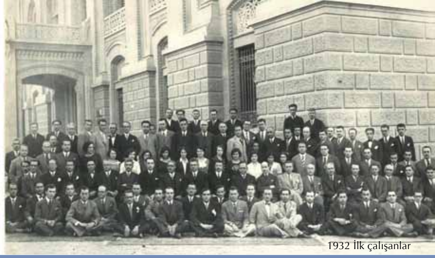
1932 İlk çalışanlar