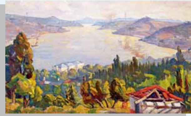
Selahattin Teoman, Nakkaştepe'den Boğaz, 1954

Eser alımları, önce Cumhuriyetin ilk yıllarını ve 1950 öncesi dönemin sanatını kapsamıştır. Koleksiyon, 1991 yılında oluşturulan Sanat Kurulunun çalışmalarıyla yenilenerek zenginleştirilmiştir. Ardından, 1990'larda yapılan alımlarda 1950 sonrası dönemin soyut ve soyutlama örneklerini yansıtan eserler koleksiyona dahil edilmiştir. Merkez