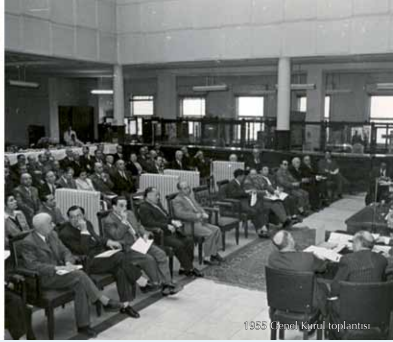
1955 Genel Kurul toplantısı

Merkez Bankasının temel politika aracı ise reeskont oranları olarak belirlenmiştir. Hükümetin, Bankanın yetkili olduğu alanlara ve kararlarına müdahale edemediği 1930'lu yıllar genel olarak Merkez Bankasının bağımsızlığının ön planda, enflasyonun ise düşük düzeylerde kaldığı yıllar olmuştur.