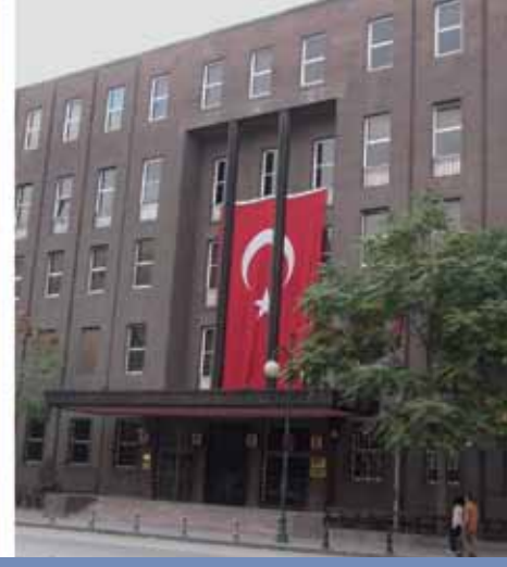
Merkez Bankası İdare Merkezi - Rölyef