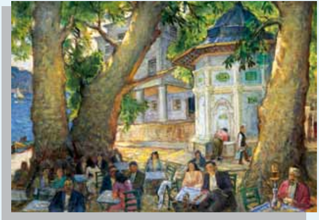
İbrahim Çallı, Çınaraltı, Tarihsiz

Bankası, çeşitli kurum ve kuruluşlarla yakın bir işbirliği içinde çalışarak sanat koleksiyonunu yurt içinde ve yurt dışında gerçekleştirdiği sergiler ve yayımladığı kataloglar aracılığıyla kamuoyu ile paylaşmaktadır. Merkez Bankası Sanat Koleksiyonundan bazı örnekler Bankanın Genel Ağ sitesinde de yer almaktadır.