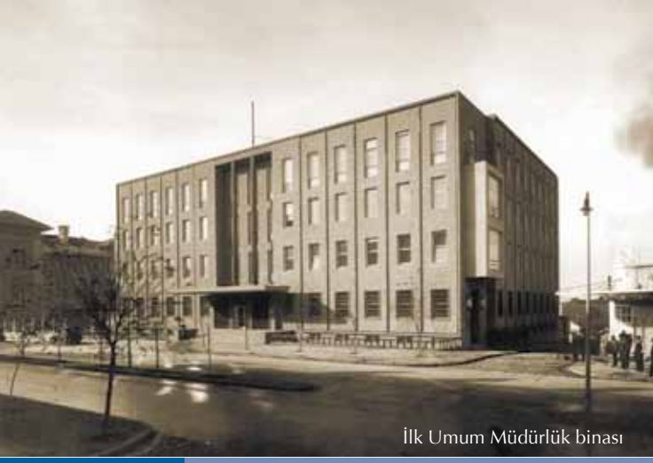
İlk Umum Müdürlük binası